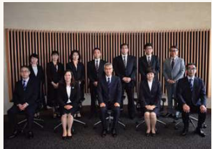
2021年6月 運営会議(運営委員集合写真)