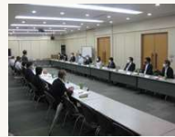
2021年7月 常任参与との懇談会