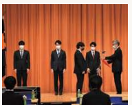
2022年3月 後援会賞授賞式