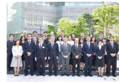
2022年6月 総長と新旧役員交代集合写真