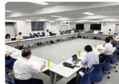
2022年6月 常任参与と運営委員の懇談会