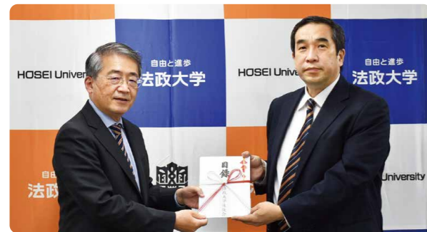
2022年11月 常務理事・後援会懇談会(校内循環バス目録を総長へ)