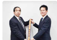
2023年6月 和佐原会長へ櫂をつなぐ