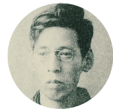
佐藤春夫 ▼ 佐藤春夫筆の母校校歌詞