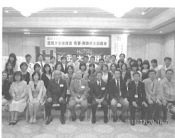
佐賀・長崎県支部

「子供の母校は我が母校」を合い言葉に、後援会に携わり法政大学の素晴らしさを実感しながら4年が経ちました。この間、会員の皆さま、大学関係者と交流を深め楽しく支部活動ができました。父母懇談会では、成績・学生生活・就職状況等のさまざまな情報を聞くことができます。また今年度は、支部創立30周年を迎え懇親会時に式典を開催いたします。お子さまの大学に触れる貴重な機会ですので多くの方々のご出席をお待ちします。