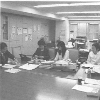
期末監査 2011年4月16日(土) 後援会事務局