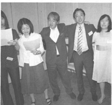
青森県支部総会・父母懇談会 2010年7月18日(日)「アラスカ」 懇親パーティで青森県支部会員の皆さまと校歌斉唱