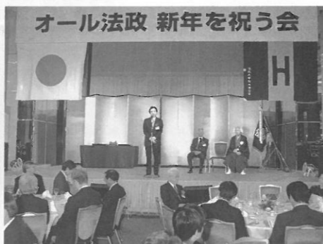
オール法政新年を祝う会 2011年1月15日(土)「グランドプリンスホテル」