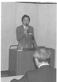
役員研修会 2010年6月26日(土) 「日本出版クラブ会館」 会長あいさつ