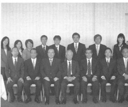
関西大学教育後援会との研修会 2010年10月29日(金) 「ポアソナード・タワー」にて記念撮影