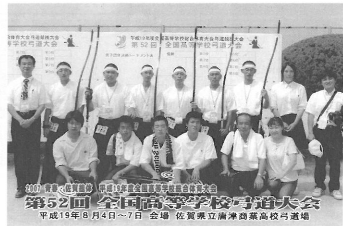
第52回全国高等学校弓道大会/高校3年(後列右から4人目)

と思います。弓道部で得たものが、これからの人生において大きな財産になると信じております。法政にお世話になったことに感謝しつつ、これからの法政大学弓道部および体育会の発展をお祈りしております。