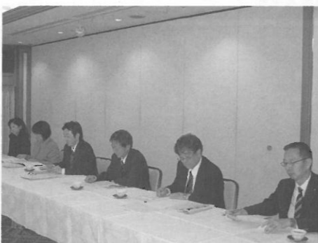
総長・学内理事との懇談会 2010年12月1日(水)「アルカディア市ヶ谷」