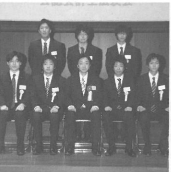
公認会計士試験合格祝賀会 2011年1月22日(土)「薩埵ホール」 後援会賞受賞者と記念撮影