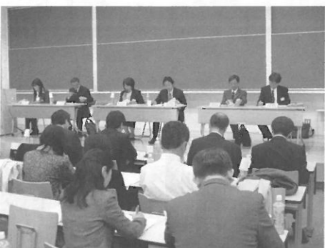
支部長会議 2010年11月6日(土)「外濠校舎」