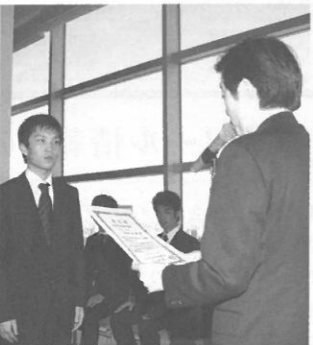
後援会賞授賞式 2011年3月5日(土) ポアソナード・タワー「スカイホール」 後援会事務局